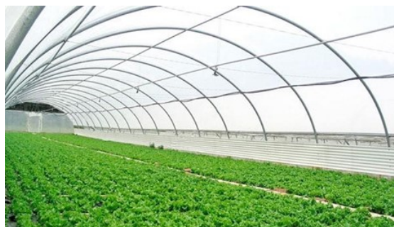
Fig. 1. Invernadero.

El sistema propuesto en la investigación realizada por [30] se considera inteligente porque es capaz de monitorizar, de forma autónoma, la temperatura exterior y el consumo de energía en horas punta, para generar con precisión la temperatura de referencia adecuada y garantizar que la temperatura del invernadero alcance esta temperatura de referencia. Además, este sistema puede identificar el ángulo de los rayos del sol para controlar la apertura y el cierre de los toldos, lo que se traduce en reducir los efectos de las altas temperaturas.